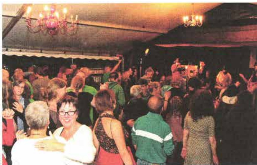
Folkfestival Ham: Het intieme en gezellige Folkfestival